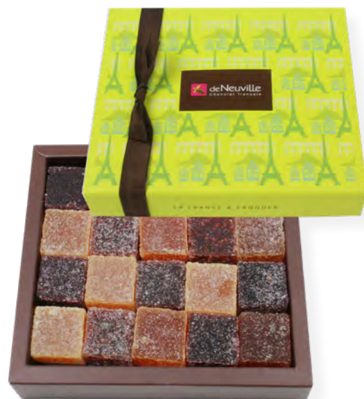
24. Coffret 20 pâtes de fruit (380g)

Pour un cadeau au goût intense de fruits.