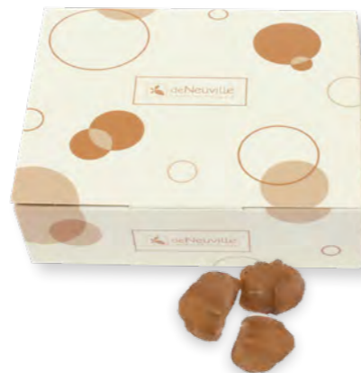
16. Coffret marrons en morceaux (250g)

Un goût franc et intense de châtaigne grillée.