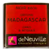
Chocolat noir 66% au goût frais et acidulé