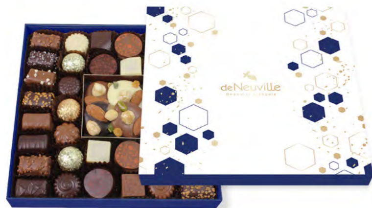
23. Coffret de Noël (420g)

Un magnifique coffret garni de fins chocolats, de minis mendiants et de boules en chocolat à la ganache noire et au praliné rustique. Faites plaisir à coup sûr !