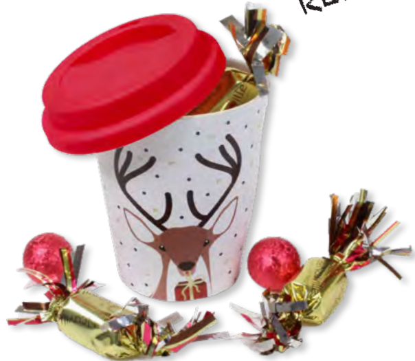
19. Petit mug chocolat (135g) Mug 100% naturel en bambou garni de boules en chocolat et de papillotes en chocolat