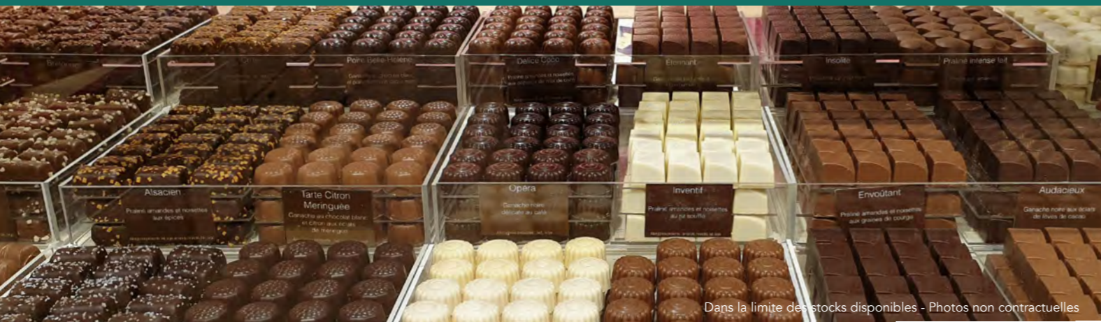
Dans la limite des stocks disponibles - Photos non contractuelles

Depuis 1884, la maison de Neuville met son savoir-faire au profit du palais des gourmets. Aujourd'hui ce sont 150 boutiques et leurs équipes de passionnés qui vous accueillent pour vous faire découvrir tous nos délicieux petits plaisirs.