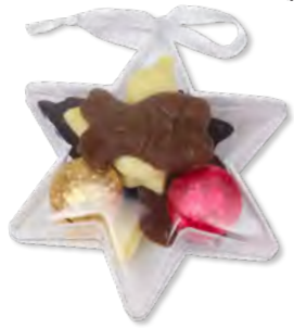
17. Étoile à suspendre (60g) Garnie de fritures et de boules en chocolat