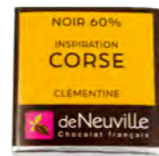
Chocolat noir 60% à la clémentine