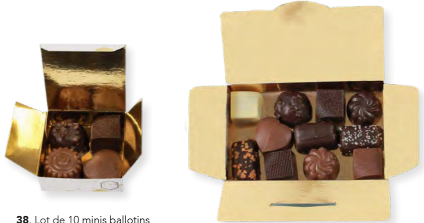
38. Lot de 10 minis ballotins (40g x10) 39. Ballotin 11 chocolats (110g)