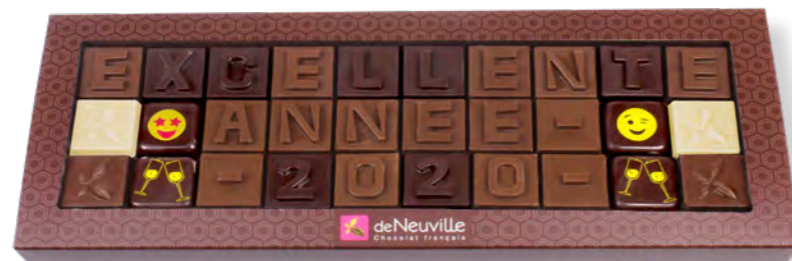
11. Message «Excellente année 2020» (150g)