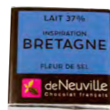
Chocolat au lait 37% à la fleur de sel