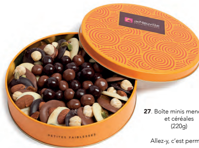
27. Boîte minis mendiants et céréales (220g)