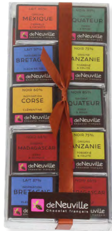
25. Réglette 40 carrés dégustation (200g)

Goûtez aux origines du chocolat. Acidulé de Madagascar, fruité de Tanzanie, lacté du Mexique, découvrez les goûts de nos napolitains.