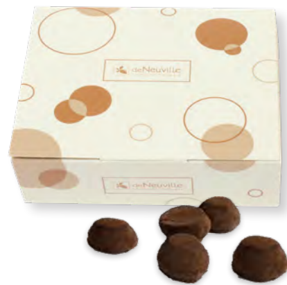
14. Coffret truffes véritables (250g)

Elles sont truffées de bons ingrédients pur beurre de cacao et chocolat 58% pour une texture tendre et fondante.