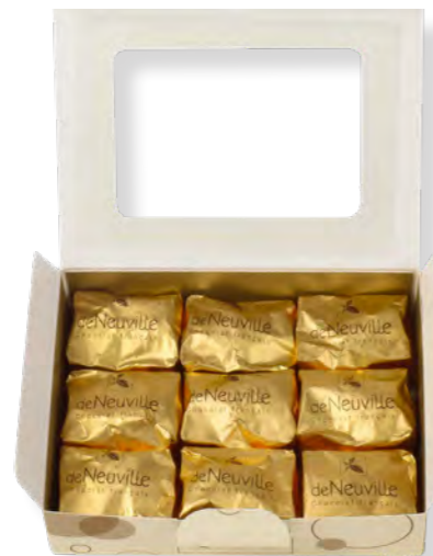
15. Coffret 9 marrons glacés entiers de Naples (165g)

Elles sont truffées de bons ingrédients pur beurre de cacao et chocolat 58% pour une texture tendre et fondante.