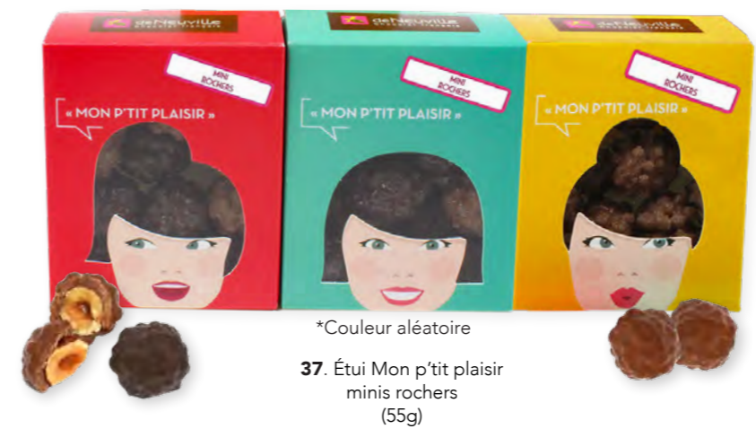
*Couleur aléatoire 37. Étui Mon p'tit plaisir minis rochers (55g)

Une petite gourmandise pour un maximum de plaisir !