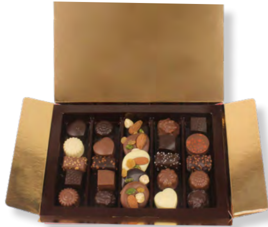
12. Coffret de Noël taille 1 (245g)