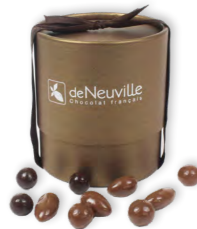
26. Coffret céréales, amandes et noisettes (200g)