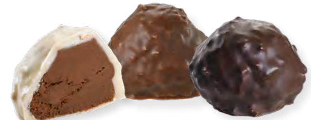
34. Rocher blanc (40g) 35. Rocher lait (40g) 36. Rocher noir (40g)

Un cœur fondant de praliné noisette sous une couverture de chocolat blanc, lait ou noir, parsemée d'éclats d'amandes croquants.