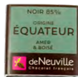
Chocolat noir 85% au goût amer et boisé