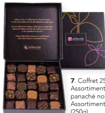
7. Coffret 25 palets Assortiment panaché noir et lait (7A) Assortiment noir (7B) (250g)