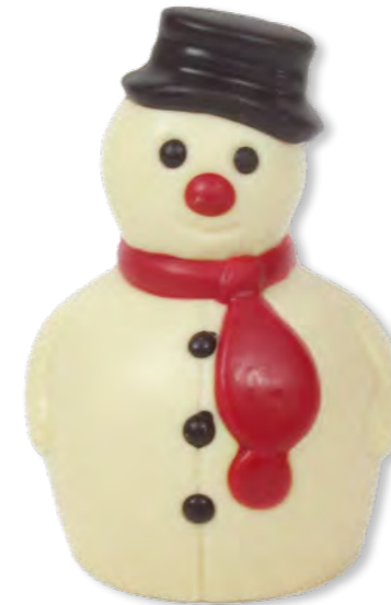
21. Bonhomme de neige (80g) Moulage en chocolat blanc

COULEURS 100% NATURELLES DÉCORÉ À LA MAIN