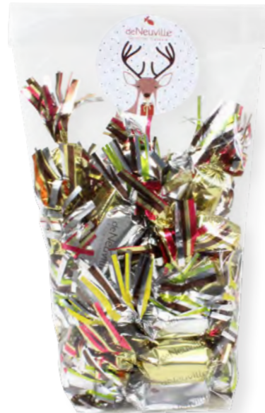
20. Sachet de papillotes en chocolat (300g)