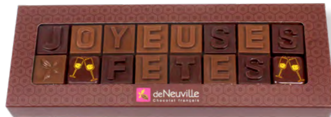
10. Message «Joyeuses fêtes» (80g)