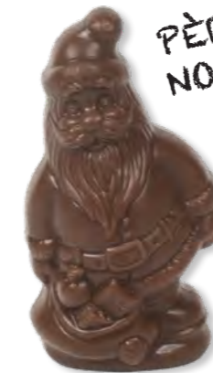
22. Mini Père Noël (25g) Moulage en chocolat au lait