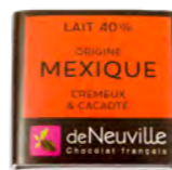
Chocolat lait 40% au goût crémeux et cacaoté