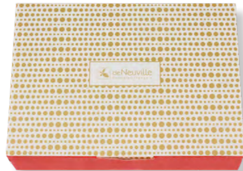
13. Coffret de Noël taille 2 (495g)