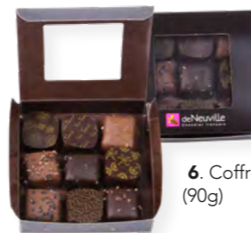
6. Coffret 9 palets (90g)