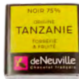
Chocolat noir 75% au goût torréfié et fruité