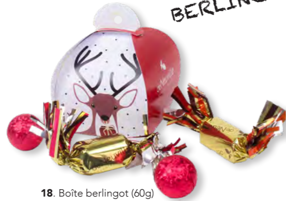
18. Boîte berlingot (60g) Garnie de boules en chocolat et de papillotes en chocolat