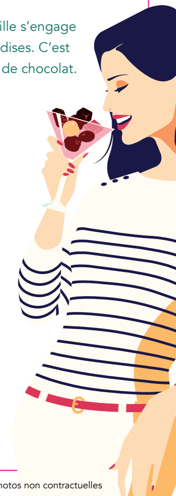
Dans la limite des stocks disponibles - Photos non contractuelles

Notre plan d'action 2019 : continuer à utiliser toujours moins d'additifs et de conservateurs, notamment en supprimant les colorants azoïques.