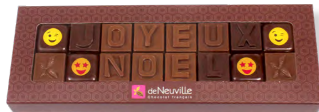
9. Message «Joyeux Noël» (80g)